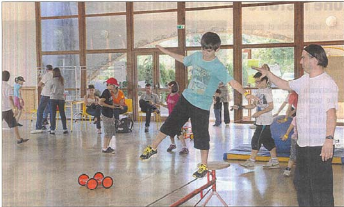
Les animations ont été appréciées des enfants.

Comme chaque année depuis maintenant cinq ans, la communauté de communes Bozouls-Comtal (Bozouls, Gabriac, Montrozier, Rodelle et La Loubière) lance la traditionnelle opération en faveur des adolescents de son territoire. Cette manifestation appelée