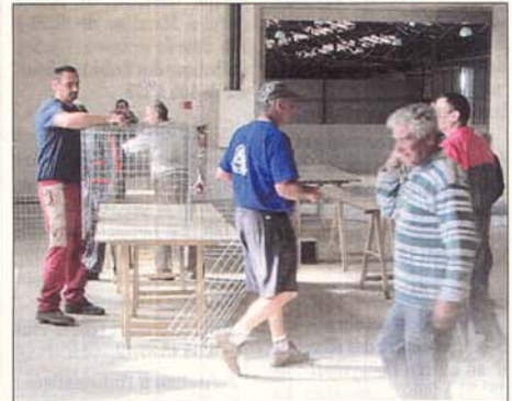
Construction des cages.

Si l'association bozouloise se félicite de la confiance de l'Orpington club de France et de la Fédération française de volaille qui lui ont confié l'organisation de ce championnat de France unique, il y a toutefois un revers à la médaille... En effet, pour pouvoir loger, le temps