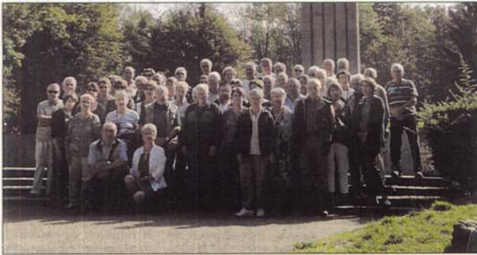
Le groupe des participants.

C'est un voyage plein d'émotion qu'ont vécu les 55 participants du comité Fnaca de Bozouls Comtal, du 8 au 12 septembre.