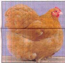
Poule Orpington fauve.

Les adhérents de l'Association des aviculteurs aveyronnais (3A) sont ravis. En effet l'exposition nationale d'Aviculture de Bozouls accède pour la première fois de son histoire au rang d'exposition internationale d'Aviculture.