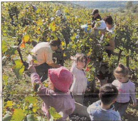
Les enfants ont bien travaillé !

Avec la complicité de l'équipe des viticulteurs de la Maison de la Vigne et du Vin d'Estaing, les petits vigneron ont pu s'initier à la récolte et voir la