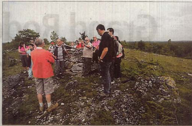
Grands espaces et beauté sauvage, l'Aveyron fait le plein de sites classés.

Dire que l'Aveyron est un terrain de jeu pour la nature est un euphémisme. Les sites classés Natura 2000 se multiplient, à l'image de celui intitulé « Vieux arbres de la haute vallée de l'Aveyron et des abords du Causse Comtal » qui sera présenté au public ce soir à 20 h 30 à l'espace Denys-Puech. « Le site a révélé toute sa richesse et même de très belles surprises. Au niveau du volet flore, les naturalistes du bureau d'étude de Rural Concept ont pu apprécier toute la richesse et la diversité des prairies naturelles de fauche et des pelouses. Du côté de la faune, le bureau d'étude Exen a également fait de très belles découvertes sur les chauves-souris. Les vieux arbres se sont également révélés à la hauteur des espérances de l'entomologiste de l'Adasea. d'Oc, justifiant pleinement la désignation de ce site dans le réseau Natura 2000 », résume Nicolas Cayssiols, chef de projet pour Rural Concept en Aveyron. En chiffres, l'inventaire a porté sur 1196 gros à très gros arbres (plus de 100 cm de circonférence) qui sont pour certains contemporains de Victor Hugo et pour d'autres de Molière ou de La Fontaine. Quelques spécimens dépassent les 341 cm de circonférence ! « Tous les insectes saproxyloph-