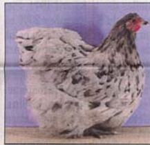
Poule Orpington splash.

Le règlement du club Français de l'Orpington prévoit en effet de récompenser du titre de champion de France, le meilleur éleveur Français mais également du titre de champion international, le meilleur éleveur toutes nationalités confondues. Aussi, les éleveurs Français seront très attentifs aux sujets que les éleveurs Belges vont amener. Ces derniers, en effet, tiennent actuellement le haut du pavé en variété « fauve » et « blanche » et il ne serait pas étonnant qu'ils trussent les meilleures places.