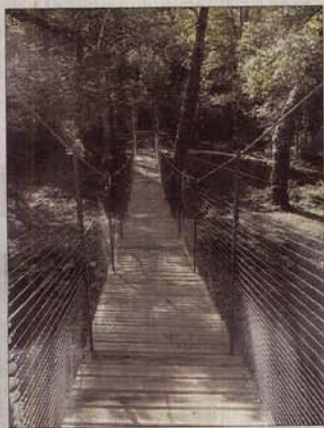
L'une des quatre passerelles installées pour enjamber le canyon.