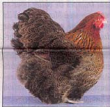
Poule Orpington perdrix.

Le temps d'un week-end, Bozouls sera donc la capitale avicole de l'Europe. En effet, la nouvelle est tombée dimanche 18 octobre, une délégation parmi les meilleurs éleveurs du Danemark, d'Allemagne et de Belgique ont entériné leur par-