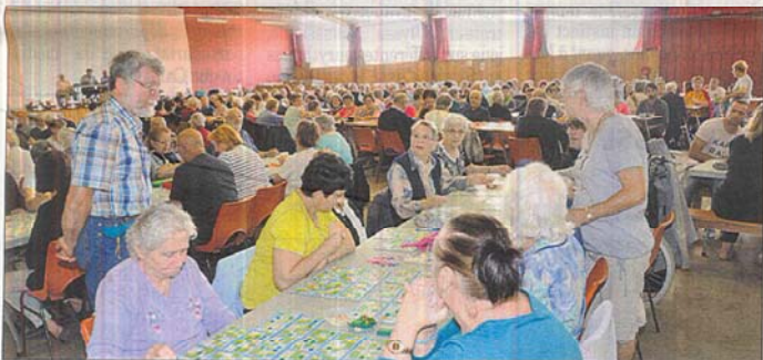
Dans la salle des fêtes de Bozouls, plusieurs pleines tables étaient réservées à la Maison d'accueil : les résidents, bien accompagnés par le personnel des Caselles et les bénévoles de l'A.P.E.G., ont ainsi pu participer à ce jeu de société, en présence de leurs familles et amis !

Dimanche 28 septembre, comme à chaque début de l'automne, l'Amicale pour les échanges entre générations (APEG), en collaboration étroite avec la Maison d'accueil de Bozouls, organisait un quinquagésimaire important. Rendez-vous était donné à 14h à la salle des fêtes de Bozouls. C'est ainsi que quelque 300 personnes se sont montrées fidèles à ce nouveau rendez-vous ludique, placé sous le signe du divertissement et de la convivialité.