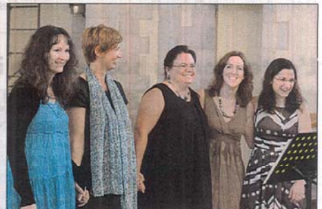
Le groupe Galéleï.

A l'issue du concert, les convives ont pu admirer le travail effectué sur les vitraux par