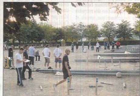
De nombreux quilleurs présents.

Après l'effort, le réconfort et cette douce soirée sportive se