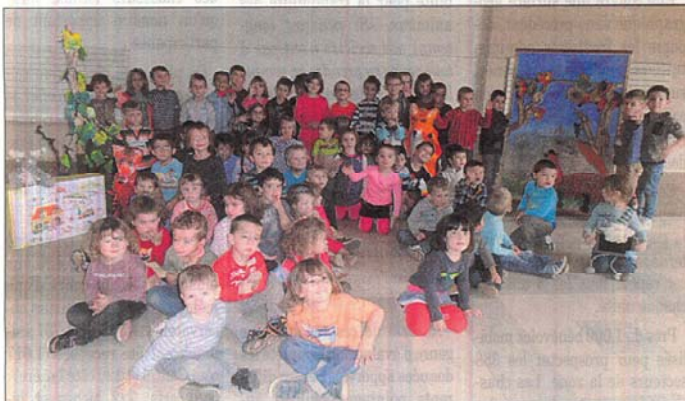
Des petits artistes en herbe.

A l'occasion du 5 e «Jardin d'automne» organisé par l'association «les Jardifolies» du Cayrol le 5 octobre dernier et dont le thème de l'année était «La journée de la vigne et du raisin», un grand concours artistique à destination des écoles était, cette année encore, organisé.