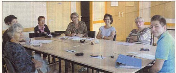
Les membres réunis pour l'assemblée générale.

Vendredi 26 septembre s'est tenue l'assemblée générale de l'atelier Boz'arts.