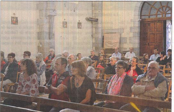
Les participants au concert en l'église de Barriac.

ment et sera visible d'ici la fin de l'année. Un grand bravo aux organisateurs et à l'ensemble « Galéleï » en attendant la réception définitive du chantier.