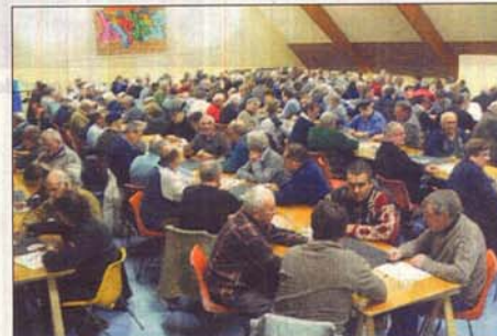
Salle comble pour la belote des quilles.

Il faut dire qu'au-delà de l'organisation impeccable à laquelle le club nous a habitués, la moitié des participants récompensés à l'issue des quatre parties du concours étaient là pour ce dernier rendez-vous de l'année. Et le concours fut relevé, près de dix équipes affi-