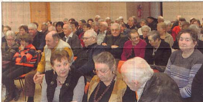
Les nombreux participants à l'assemblée générale.

L'assemblée générale de l'association s'est déroulée le lundi 6 janvier.