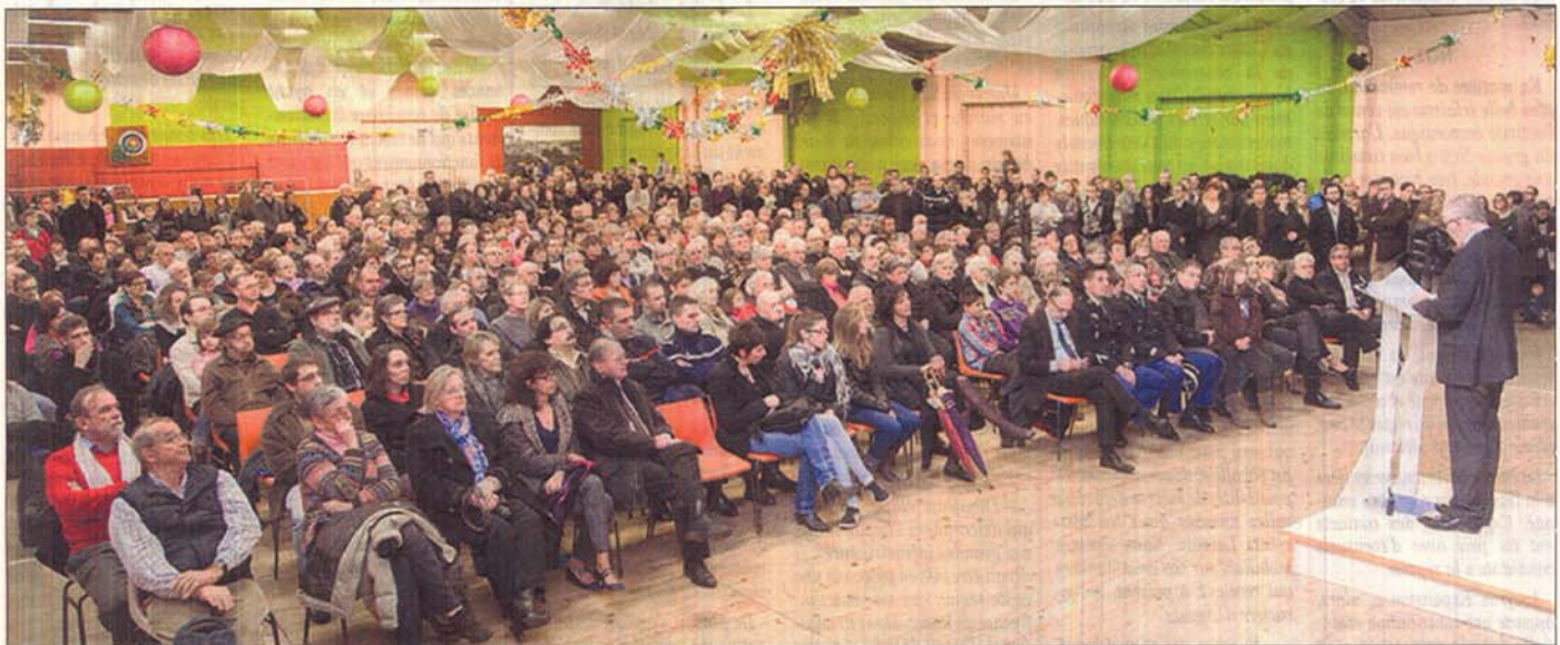
Salle comble pour cette cérémonie des vœux.

— L'aménagement du centre répond à un besoin identifié et s'inscrit dans une volonté de structurer la vie de Bozouls de