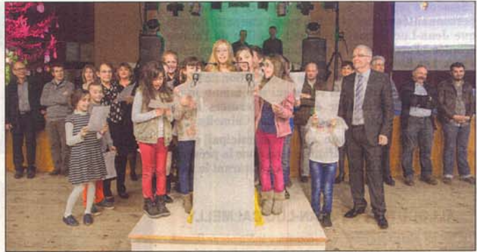
Le conseil municipal des enfants présente ses vœux.

— Deuxième étape : le SCOT qui déterminera l'implantation des grandes infrastructures. Il devait être mis en place sur une vaste région qui vit sous l'influence de Rodez. Dans la négation de l'esprit de la loi et contre notre avis, son périmètre se li-