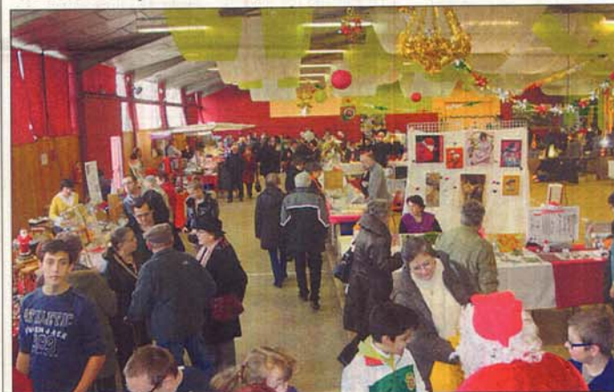
Les visiteurs sont venus nombreux tout au long de la journée.

des visiteurs venu en balade ou à la recherche de la dernière pièce à mettre sous le sapin ou à la table du réveillon rythma le déroulement du marché. Une bien belle animation donc qui trouva cette année encore son public et il y a fort et à parier que l'on peut d'ores et déjà réserver le rendez-vous pour la troisième édition du marché de Noël de décembre prochain.