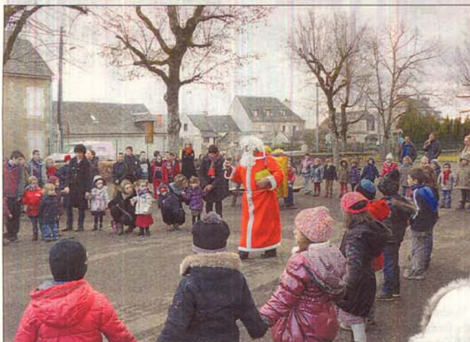
L'arrivée du Père Noël dans la cour de l'école.

Vendredi 20 décembre, les enfants de l'école Saint-François, après un après-midi d'échange intergénérationnel musical au sein de la maison d'accueil des Caselles, se retrouvaient dans la cour de l'école attendant avec impatience la venue du Père Noël.