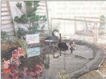
De magnifiques cygnes noirs.

Près de trente-sept départements du Nord au Sud du pays étaient représentés pour l'occasion, soit cent quatre-vingts éleveurs. Aux côtés de ces deux championnats, ce n'étaient pas moins de 2.000 animaux de basse-cour et lapins, de toutes races, qui étaient exposés sous le quillodrome pour le plus grand plaisir des yeux des enfants et des grands, venus nombreux visiter cette remarquable exposition et les nombreuses mises en scène, réalisées pour partie par le lycée agricole de Rignac, toujours présent aux côtés de 3A à l'oc-