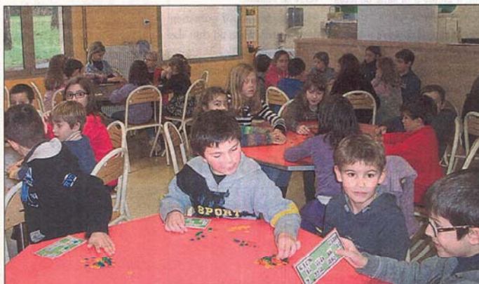
Les enfants ont participé à un quine.

Vendredi 24 janvier, les enfants de l'école Saint-François ont eu le plaisir de fêter le saint patron de leur école : Saint-François de Sales.