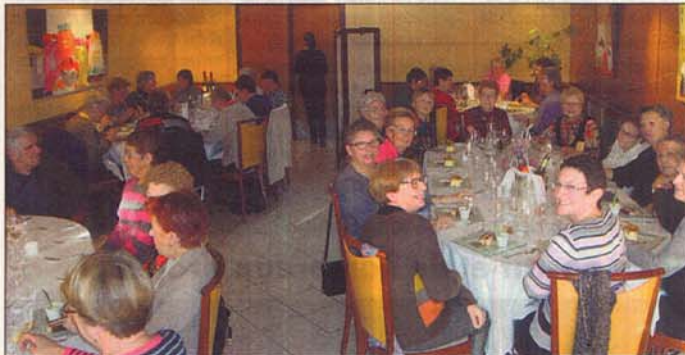
Fin d'année autour d'une bonne table.

Et oui, on sait bien qu'avec le mois de décembre sonne l'heure des repas de fin d'année, des moments conviviaux et festifs.