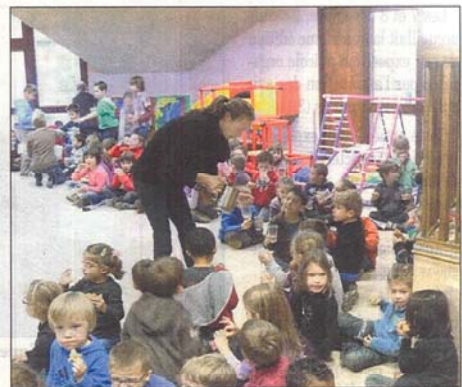
Les enfants ont dégusté un excellent goûter.

Le repas de midi fut lui aussi festif et laissa place à un après-midi musical. Les enfants furent en effet conviés à un spectacle offert par la Cabrette du Haut-Rouergue dans les salles du Centre social, alliant chants et danses de notre pa-