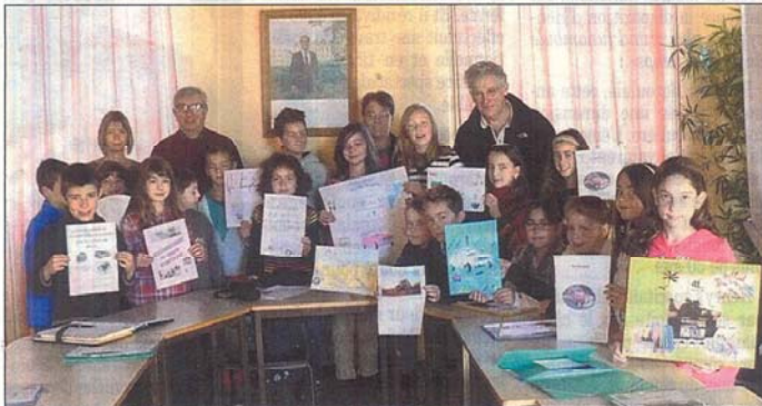
Les jeunes conseillers présentant leurs affiches.

On a déjà eu le plaisir d'évoquer le dynamisme, l'implication et la richesse d'idées qui émanent du conseil municipal des jeunes de Bozouls. Alors que les nouveaux prennent leurs marques auprès des plus grands, de nombreux projets se font déjà jour et, comme à l'accoutumé, on ne peut qu'évoquer leur travail et leur dévouement solidaire.