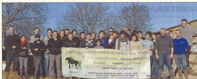
Mobilisation pour l'entretien du club.

Plus d'une trentaine de membres de l'association les Cavaliers de la Causse se sont réunis samedi 4 janvier afin d'œuvrer à l'entretien d'un club qui, ces derniers temps, ne se montrait plus aussi accueillant qu'il le devait.