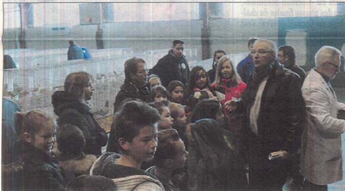
Les enfants ont été ravis de visiter cette exposition.

Rendez-vous est d'ores et déjà pris pour 2014 et une cinquième édition qui devrait accueillir les championnats de France de la poule «Orpington» et du pigeon «Tambour».