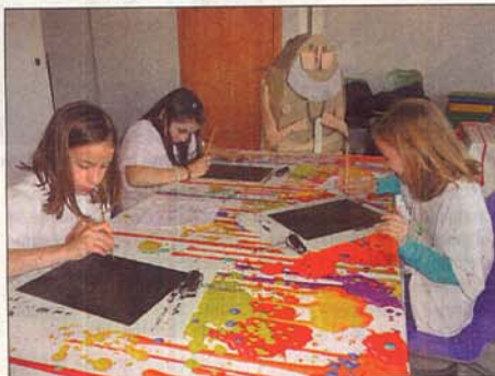
Les ateliers artistiques ont été appréciés.

Les enfants étaient ensuite attendus au musée Fenaille, pour un voyage dans le temps de près de 5 mille ans. Ils ont ainsi pu découvrir l'univers du