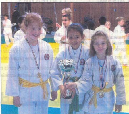
Bravo à l'équipe féminine.