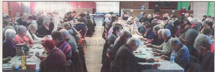
De nombreux quineurs à la salle de fêtes.

Malgré un soleil radieux qui invitait à la promenade, la salle de fêtes de Bozouls s'est remplie, dimanche 15 décembre, pour le quine paroissial.