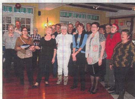
Les membres de la chorale ont toujours plaisir à se retrouver.

Ce fut une bonne répétition pour le concert donné le lendemain dans une maison de retraite où ils furent très applaudis et c'est un bien juste