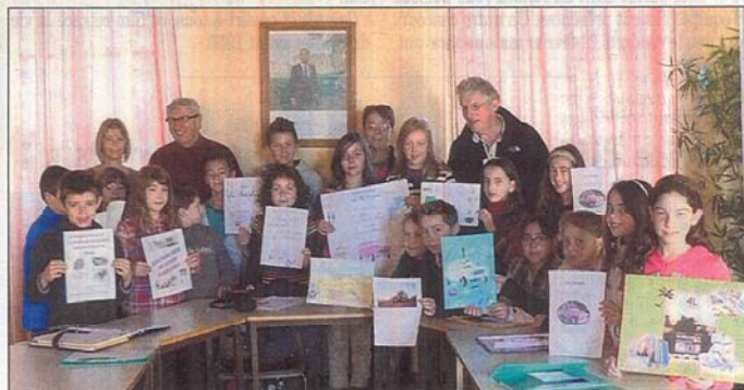
Le conseil municipal des enfants s'implique dans le 4L Trophy.

Le conseil municipal des enfants a choisi cette année d'accompagner l'aventure 4L Trophy. Ce raid 4L Trophy représente une formidable aventure humaine, sportive et solidaire, pour des étudiants entre 18 et 28 ans, un périple de 10 jours sur 6.000 km sur les routes de France, d'Espagne et sur les pistes du Maroc afin de rejoindre et de franchir la ligne d'arrivée à Marrakech.