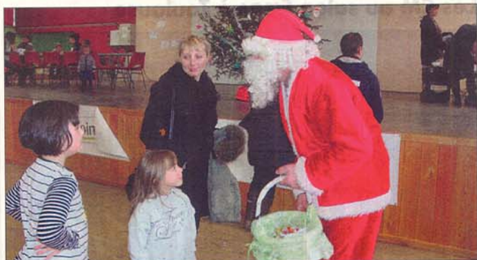
Le Père Noël était là !

Dimanche 22 décembre, l'office de tourisme de Bozouls organisait la seconde édition de son marché de Noël.