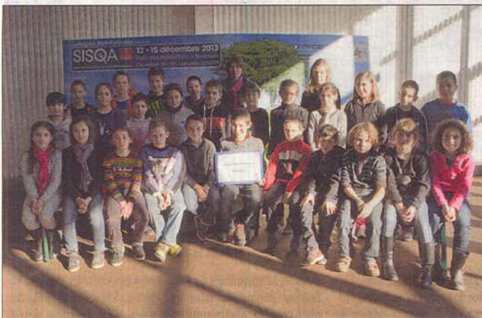
Les élèves de CM au salon SISQA à Toulouse.

Jeu 12 novembre, les élèves de l'école Saint-François se sont rendus au Salon de la qualité alimentaire (SISQA) à Toulouse.