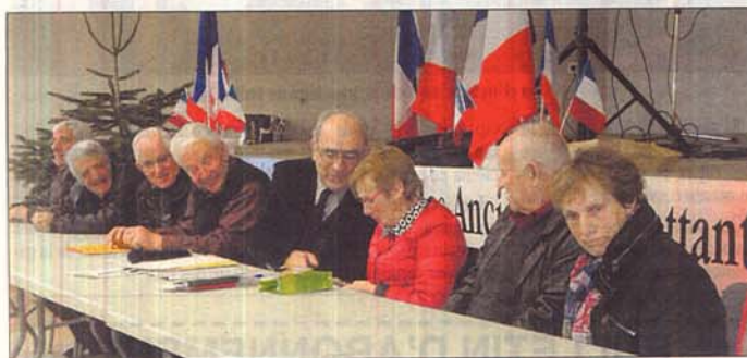
Le bureau du comité FNACA.

Samedi 14 décembre, le comité FNACA Bozouls - Causse-Comtal a tenu son assemblée générale en la salle de fêtes de Gabriac, où 117 personnes étaient présentes.