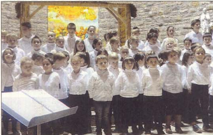
Les enfants ont donné le meilleur d'eux-mêmes.