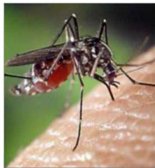
Un moustique un peu plus gros et muni de taches blanches.

Le moustique tigre a la possibilité de transmettre des maladies tropicales telles que la dengue, le virus Zika ou le chikungunya. En 2022, 56 cas importés ont été re-