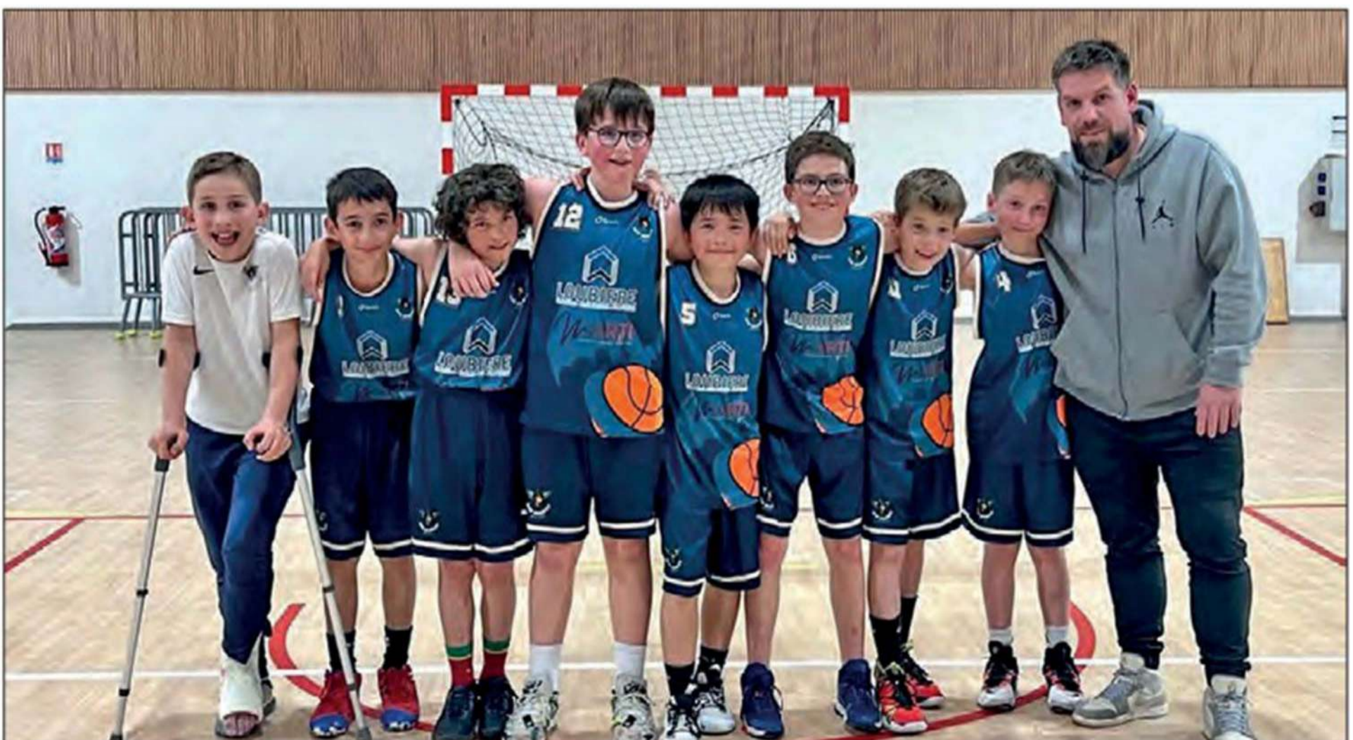
L'équipe 1 des U13 invaincue cette saison.

Notons par ailleurs la belle participation de l'équipe 2 des U13 garçons qui ne démérite pas en se plaçant 4 e de ce même championnat. Félicitations à eux.