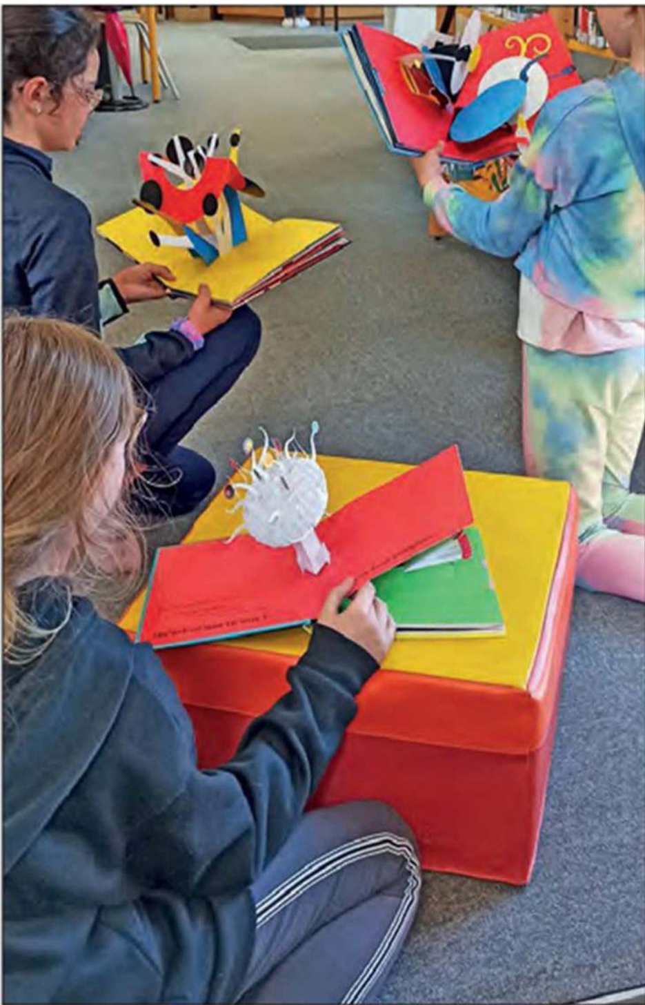
A l'occasion de la fête mondiale du jeu.

En mai, c'est la fête mondiale du jeu. A cette occasion, la médiathèque André Baudon de Bozouls souhaite mettre en lumière l'univers ludique dans la médiathèque en commençant par des rendez-vous lectures ludiques, puis au fil des mois par des sélections et des surprises à venir.