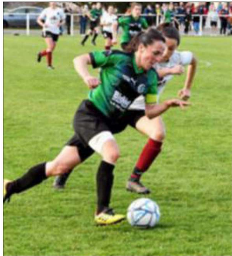
Les Bozoulaises rêvent de doublé.

La grande fête du football départemental effectue son retour à Paul-Lignon. Après quatre ans de rendez-vous manqués, pour raisons sanitaires ou travaux, l'enceinte de la rue Vieussens va de nouveau vibrer avec la ferveur des finales de coupe de l'Aveyron, aujourd'hui. Côté féminin, une affiche au sommet opposera à 16 heures les deux leaders du championnat de Départemental 1, Bozouls et Montbazens-Rignacois. Après leur victoire dans cette même compétition la saison dernière ainsi que leur sacre en championnat cette année, les Bozoulaises briguent un nouveau trophée. Leurs adversaires espèrent quant à elles apporter un autre trophée majeur au club qui vit sa première saison depuis sa fusion totale, déjà récompensé chez les garçons par le titre en D1. Chez les hommes, Espalion fait figure de favori pour la finale, à partir de 20 h 40. Troisièmes de