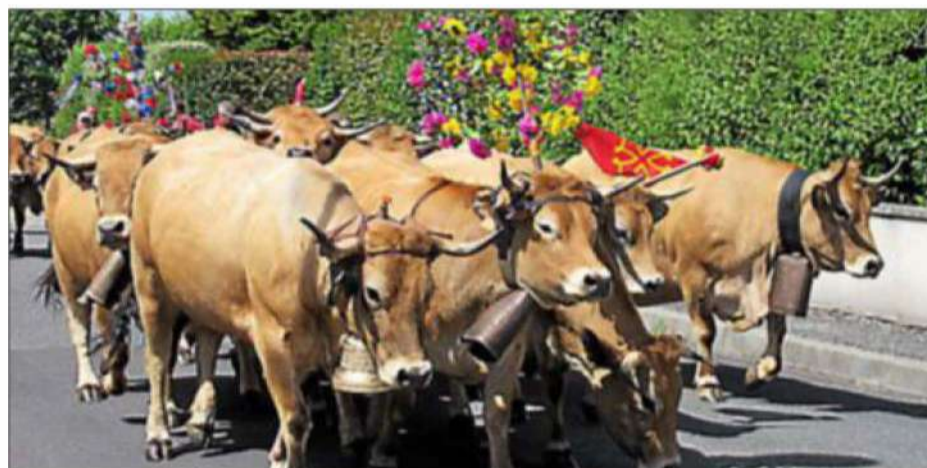
Un moment de fête lors du passage du troupeau.

Ainsi, le samedi 27 mai à 11 h aura lieu la traditionnelle étape transhumance à la maison d'accueil Les Caselles de Bozouls (terrain à l'arrière de l'établissement). Le troupeau fera halte