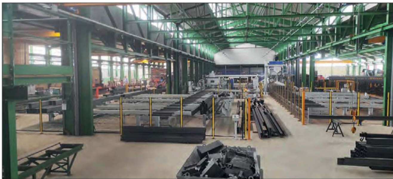
Les ateliers ont doublé en 2022 et accueillent une nouvelle unité de fabrication automatique HDX.