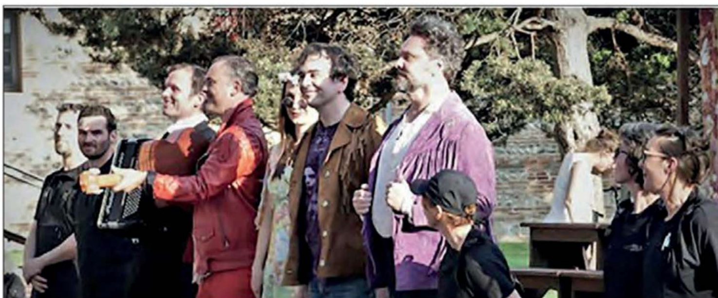
Ce samedi 20 mai à 18h au parc de l'église Sainte-Fauste.

Contact et renseignement auprès du service culture : 05.65.48.33.90 ou culture@3clt.fr