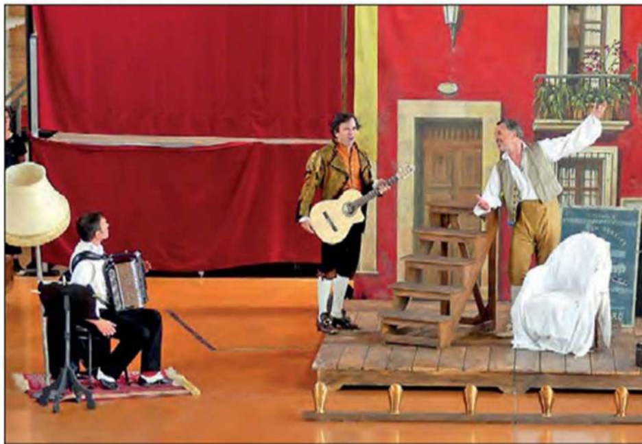
Le Barbier de Séville, de Rossini, version "poche" : 1 heure de spectacle virevoltant... et gratuit !

Adapté par le librettiste Dorian Astor et mis en scène par Frédérique Lombart, cet opéra de poche, d'une durée d'une heure (près de trois heures dans sa version complète), met en scène les personnages principaux de l'œuvre de Rossini : Rosine, le comte Almaviva, Bartolo et Figaro. Ils sont interprétés par quatre acteurs de l'Opéra National du Capitole, qui sont aussi des chanteurs,