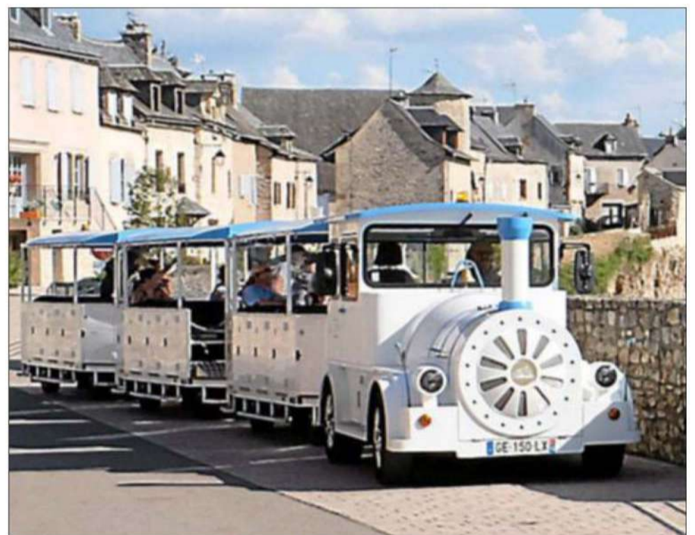
Une visite en petit train pour découvrir le site.

Réservations et informations au 06 33 19 52 29.