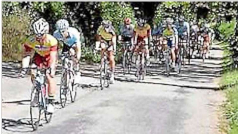
Une belle course au programme.

La course comptera 7 tours de 11 km. Les coureurs emprunteront la route de Saint-Julien-de-Rodelle, passant à Alac, puis reviendront vers Bozouls par la