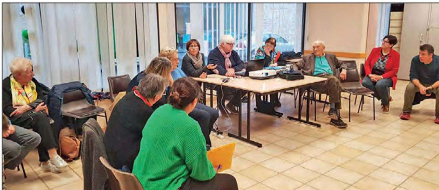
L'ADMR Bozouls Comtal présente un bilan positif.

Après le vote des résolutions, un petit film était proposé montrant le rôle des bénévoles au sein des associations ADMR. Un moment de convivialité était ensuite offert à tous les participants.