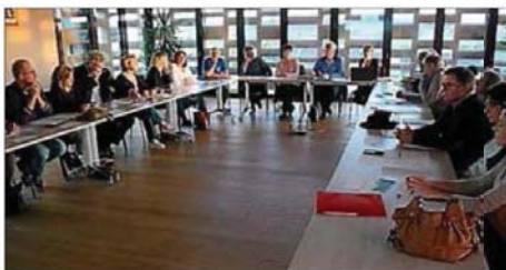
Le conseil examine le PADD en vue de la révision du PLU.

nions de travail avec le bureau d'études OC'TEHA (chargé de l'urbanisme) et une présentation au public avec les personnes associées à eu lieu le 26 mars. Les principales orientations du PADD se déclinent ainsi : organiser le développement ; soutenir l'économie communale, communautaire et de territoire ; renforcer