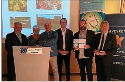
Une belle récompense en présence des élus

La Fédération Départementale des Chasseurs a reçu la mention spéciale du prix de l'environnement du Conseil départemental de l'Aveyron. Avec cette récompense, le jury a voulu primer le travail réalisé par les chasseurs aveyronnais sur le causse Comtal. En effet, grâce au Conseil départemental, à la Région Occitanie et au 1 % paysager, la Fédération a rouvert plus de 200 ha de pelouses sèches sur les communes de Sébazac-Concoures et de La Loubière. En parallèle des travaux de réouverture, la Fédération a également creusé des mares, remontées des cazelles et des murets de pierres sèches. Des cultures faunistiques sont également semées tous les ans pour favoriser les insectes pollinisateurs et les plantes messicoles. Un sentier de découverte et un livret pédagogique sont venus parachever ce programme de sauvegarde de la richesse biologique des pelouses sèches. Encore, la Fédé-