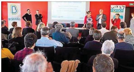
Le maire présente la commune devant les acteurs de la Coorace.

Coorace Occitanie fédère 47 structures de l'insertion par l'activité économique, défendant la vision d'une société solidaire et inclusive en permettant l'accès à l'emploi pour tous dans les secteurs variés.