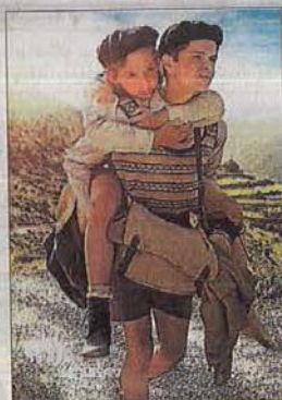
Une interprétation remarquable pour ces enfants.