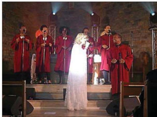
Beaucoup de générosité lors du spectacle de dimanche.

Le festival de Blues organisé par Fabrice Eulry et qui se déroule jusqu'au 19 mai a fait une étape remarquable à Bozouls. L'un de ses points d'orgue était cette soirée de gospel avec Jeane Manson. D'ailleurs on pouvait constater que dimanche dernier l'église Saint Pie X était presque trop petite pour accueillir le public venu très nombreux pour ce concert unique. Le gospel est un genre de musique chrétienne avec des dominantes vocales qui varient suivant la culture. Il s'est développé en même temps que le blues primitif. Les artistes modernes de gospel ont intégré des éléments de musique soul. Le gospel est né il y a plusieurs siècles en 1612. Le trafic d'esclaves noirs vers l'Amérique du nord commence. Ils arrivent d'Afrique, avec leur culture, leur tradition et leur croyance. Le temps passe. Sans oublier leur culture, ils découvrent puis se passionnent pour la religion chrétienne. Ils se comparent parfois aux Hébreux captifs en Egypte, pensent au peuple d'Is-