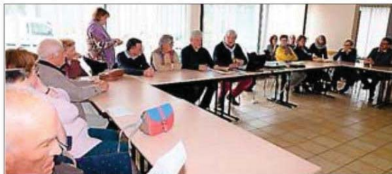
Une assemblée réunie pour la bonne cause.

Le président donnait ensuite un aperçu de l'action et du poids économique de l'ADMR sur les cinq communes de Bozouls, Gabriac,