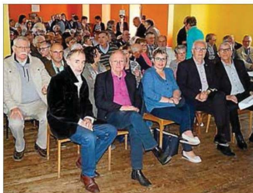
Une nombreuse assistance et d'élus pour la sortie de l'ouvrage.