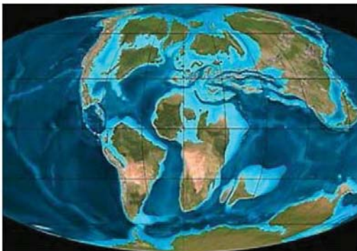
La planète lors de la période du crétacé.

Il y a 300 millions d'années environ, tous les continents étaient rassemblés en un vaste ensemble unique, la Pangée. Cet énorme supercontinent a commencé à se fragmenter il y a plus de 200 millions d'années. Sa partie méridionale, le Gondwana se