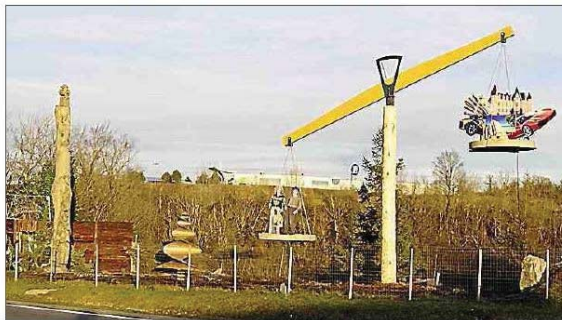
Cette balance qui penche du bon côté.

C'est ainsi que l'on peut découvrir le long de la route départementale RD 988 en face de ses installations d'Onet-le-Château une balance qui interroge. À y regarder de plus près, on distingue sur l'un des deux plateaux, regroupés tous ensemble les biens matériels représentés par une voiture de luxe, un château et des