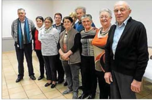
Le nouveau bureau de l'association.

Les joueurs de cartes ont rendez-vous le lundi après-midi, à 14 heures. Les répétitions de la chorale sont programmées le lundi à