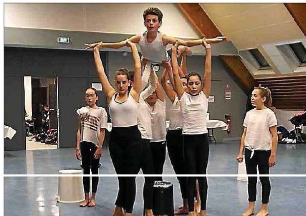
Démonstration: les enfants prennent du plaisir à danser.

L'association « dans ce corps » a présentée vendredi dernier durant une heure le travail réalisé par les enfants au nombreux public venu ce soir-là lors de leur opération « portes ouvertes ». Au cœur de la cité cette association offre un environnement d'apprentissage riche et diversifié à ses élèves. Elle accueille leurs adhérents dans des locaux dédiés à la danse au sein du centre social de Bozouls et encourage les élèves à évoluer, apprendre, créer et s'épanouir par le biais de la pratique de la danse dès l'âge de 4 ans jusqu'au adultes. Le travail, le respect et la création sont les maîtres mots de leur enseignement. Chaque cours offre l'opportunité de vivre de nouvelles expériences éducatives, so-