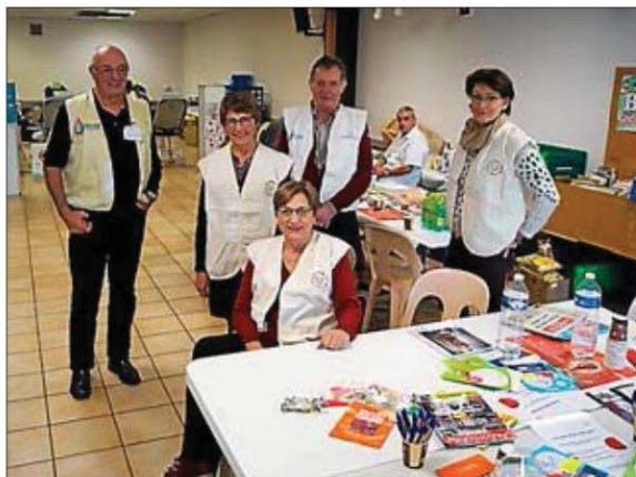
Les bénévoles lors de la collecte.

À noter également que de très nombreux donneurs se sont présentés pour un premier don, ce qui est très encourageant car ils représentent l'avenir. En espérant qu'ils se fidéliseront en revenant souvent partager ce moment de générosité et de convivialité. Les membres de la toute nouvelle