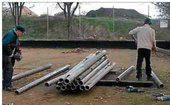
Découpe des séparateurs de jeux avant sa mise en place.

L'association remercie les services techniques de la municipalité