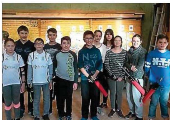
Les jeunes archers assurent la relève.

Un rappel des nouveaux tarifs des licences : 50 € pour les poussins ; 60 € pour les jeunes ; 90 € pour les archers en club et 100 € (in-