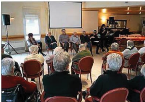
Des vœux de bienveillance et de respect lors de la cérémonie.

Elle a ensuite présenté les orientations 2019. Tout d'abord la reprise des jardins collectifs qui avaient été interrompus en raison des travaux ; les travaux dans les cuisines (celles-ci ont 20 ans et une remise à niveau devient indispensable en raison