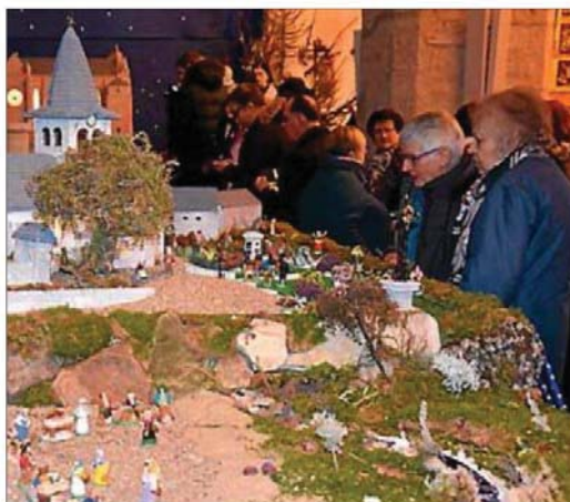
Un défi architectural très admiré.

À la fin de la visite, des chants ont été entonnés avant de se rendre à l'Auberge Fleurie pour se