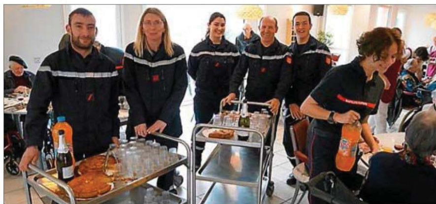
Belle initiative de la part de ces sapeurs-pompiers bénévoles.

Attachées à cette tradition festive, les personnes âgées ont non seulement apprécié un dessert pas comme les autres, mais aussi la présence rayonnante de ceux et celles qui incarnent la protection