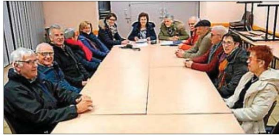
Les adhérents optimistes pour l'avenir.

Lundi dernier les adhérents de l'association « La Brocante » se sont réunis en assemblée générale afin de faire le point de leur action du 15 août. Il en ressort que cette 29 e édition a été un franc succès certes, le beau temps était de la partie mais c'est quand même 168 exposants qui ont fait le déplacement dont une majorité de professionnels : 92 exactement, 30 pour les produits régionaux et les autres exposants (les puces)