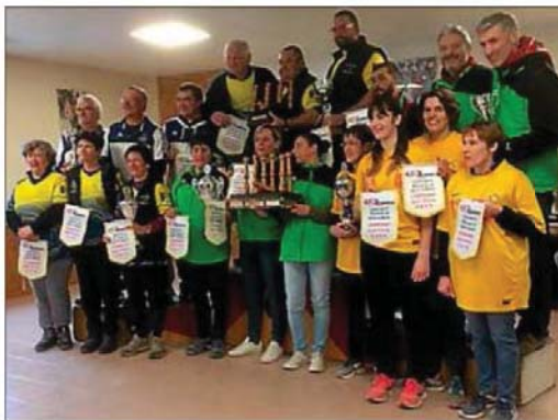
Les récompenses en fin de tournoi.

Bien que des compétitions soient organisées, le jeu se pratique aussi pour le plaisir. L'aire de jeu appelée « plantier » se situe généralement en extérieur sur un sol en terre battue, en gravillon, voire en bitume. À l'extrémité du plantier se trouve le « pitié », base rectangulaire sur lequel sont posées les quilles (les trois petites alignées devant, les grandes der-