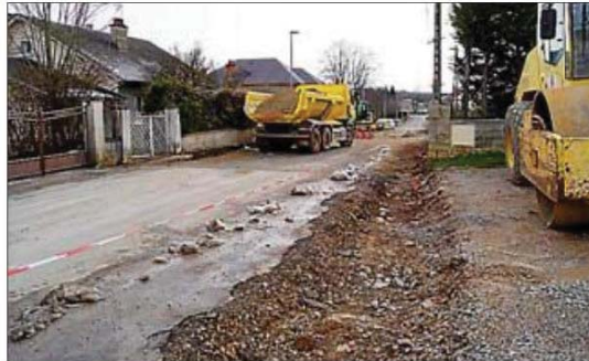
Le décaissement de la rue des Cardabelles.

Au terme de ce chantier, les carrefours seront tous requalifiés, sans oublier l'aménagement de la placette du centre de secours, de la maison assistance maternelle et du stade. La couche de