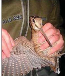
Baguage des bécasses la nuit.

Puis, dans un second temps aux alentours de 21 h 30 la soirée se poursuivra sur le terrain, de nuit quelque part dans les champs du causse Comtal. Attention si la présentation en salle est ouverte à tous et sans limites de nombre, la sortie sur le terrain implique un nombre limité de participants. En effet, il ne faut pas ralentir l'action du bagueur officiel pour ne surtout pas stresser l'oiseau plus que de raison. L'esprit du bagage étant pouvoir suivre dans le temps les effectifs de ces migrateurs. Aussi, une fois bagués,