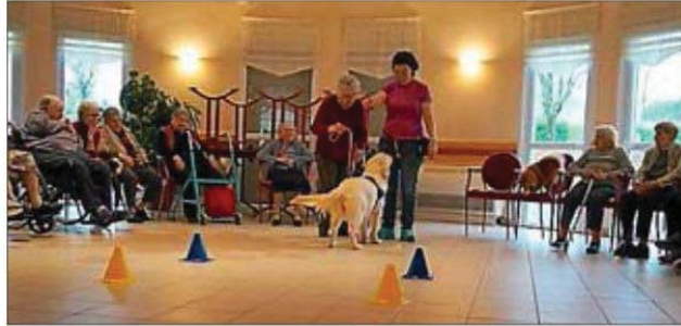
Les résidents ont pris du plaisir à cette séance.

L'exercice de la médiation en milieu institutionnel demande l'observation de règles élémentaires de prudence, d'éthique et de sécurité. La zoothérapie : faire de l'animal