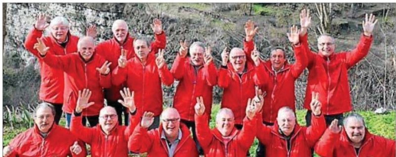
Les adhérents enjoués de leur sortie.

Un nom a été trouvé : Guidon & Fourchette, afin de bien poser les objectifs et intentions de l'association. Un slogan, le fil rouge de la pensée de chacun des membres est « Une bonne table oui, mais à condition de l'avoir méritée en ayant pédalé très dur sur les merveilleux chemins escarpés de nos campagnes. » Deux maîtres-mots : humour et convivialité.