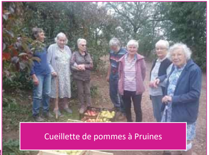
Cueillette de pommes à Pruines