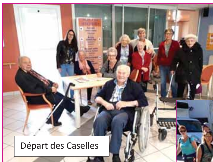
Départ des Caselles