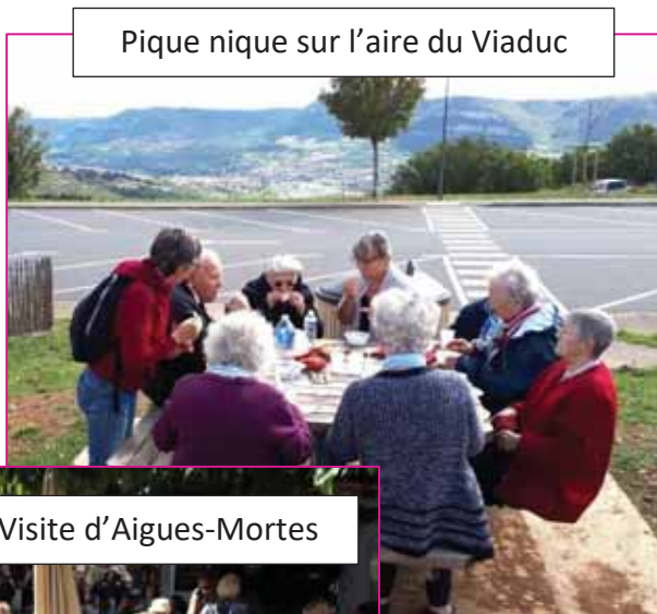
Pique nique sur l'aire du Viaduc