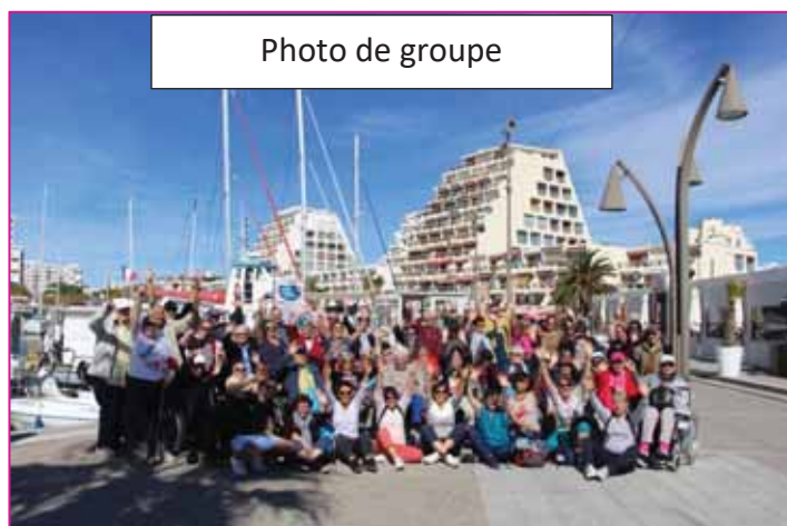
Photo de groupe