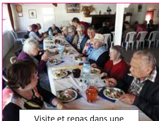
Visite et repas dans une manade