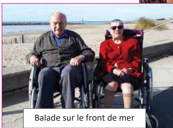
Balade sur le front de mer