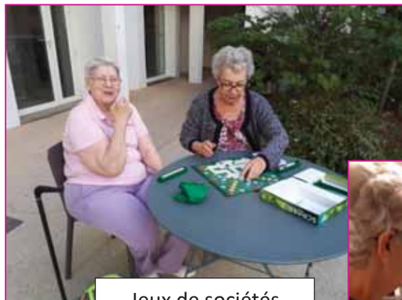
Jeux de sociétés