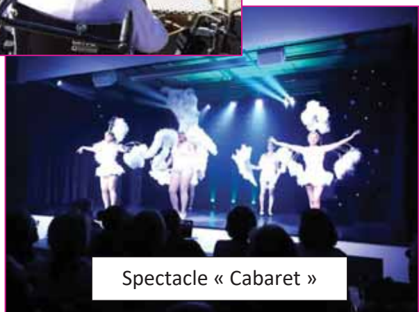
Spectacle « Cabaret »