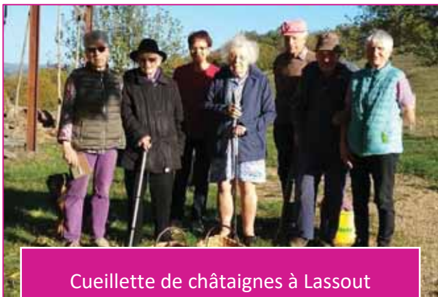
Cueillette de châtaignes à Lassout