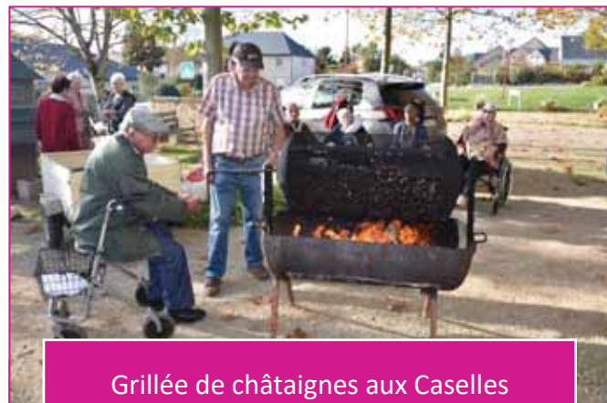
Grillée de châtaignes aux Caselles

La traditionnelle grillée de châtaignes s'est déroulée le mardi 18 octobre dernier. Sur l'esplanade des Caselles, nos bénévoles ont fait griller ces fruits tant attendus de tous. Bien cuites et toutes dorées, les châtaignes furent très appréciées. D'autres ont préféré savourer les tartines de confiture de châtaignes préparées par Odile.