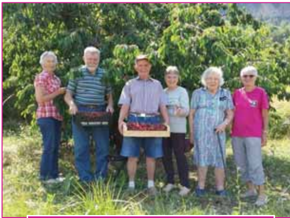
Cueillette de cerises à Paulhes