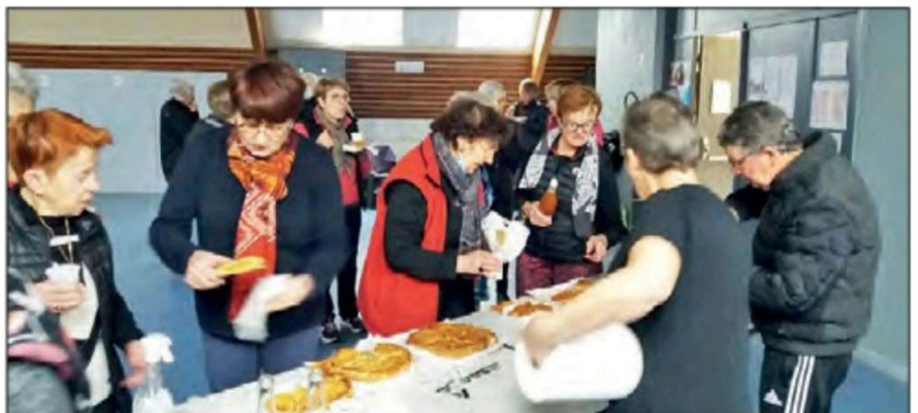
... ou au club de gym douce, on a partagé la galette.