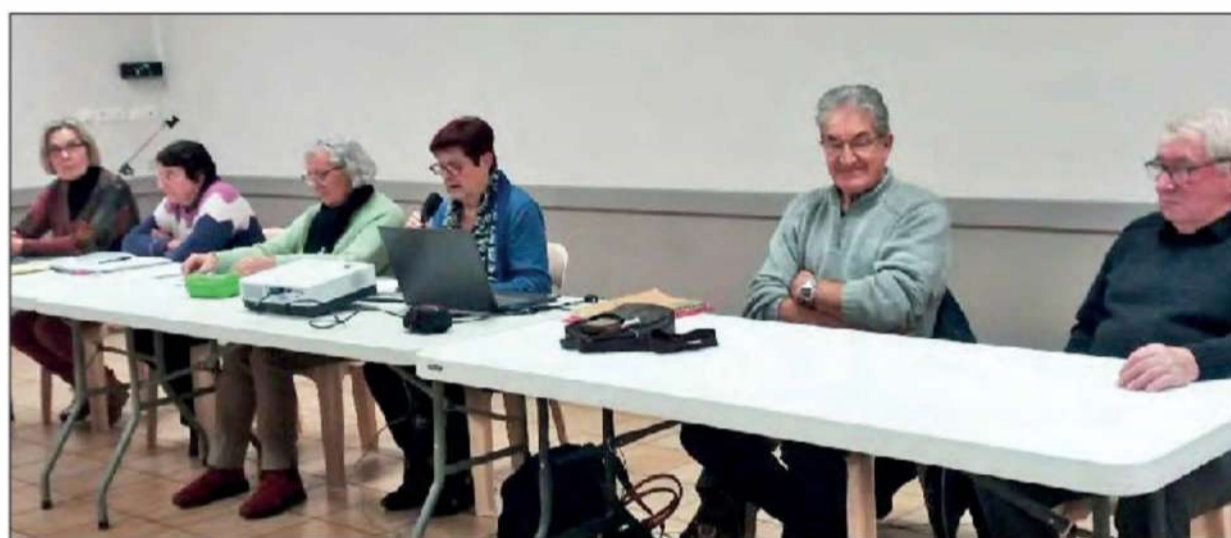
Le bureau félicité pour son investissement.

Jeudi 19 janvier, malgré une météo hivernale, plus de quatre-vingts personnes se retrouvaient, salle Denys Puech, pour l'assemblée générale annuelle du club "Soleil d'Automne". Dès 14h, les fidèles joueurs de cartes ne manquaient pas leur rendez-vous hebdomadaire et parallèlement les adhésions étaient prises. A 15h30 l'assemblée générale pouvait commencer.