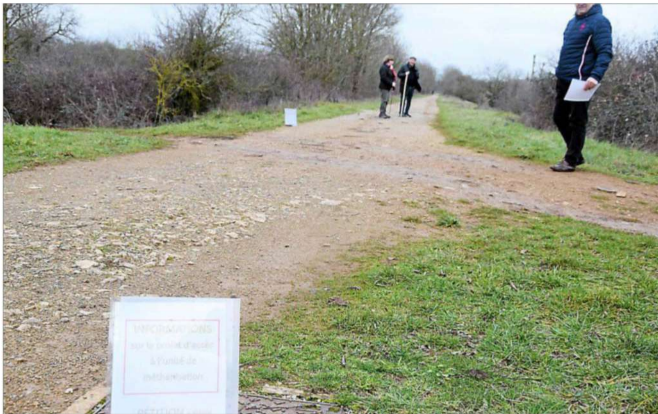
La voie verte recoupée pour laisser passer les engins, et des riverains voient rouge à Bozouls.

Il est vrai que les observations émises lors de l'enquête publique ont des airs d'un inventaire à la Prévert : permis de construire déjà délivré, projet surdimensionné, risques de pollution, impacts paysagers, etc. « Il va falloir pomper 2 200 m 3 d'eau sur la cause, en particulier la source de Bozouls, la grotte de l'Espoir et son ruisseau sans parler de l'impact déjà causé par la sécheresse. C'est une aberration. Quand on voit que le