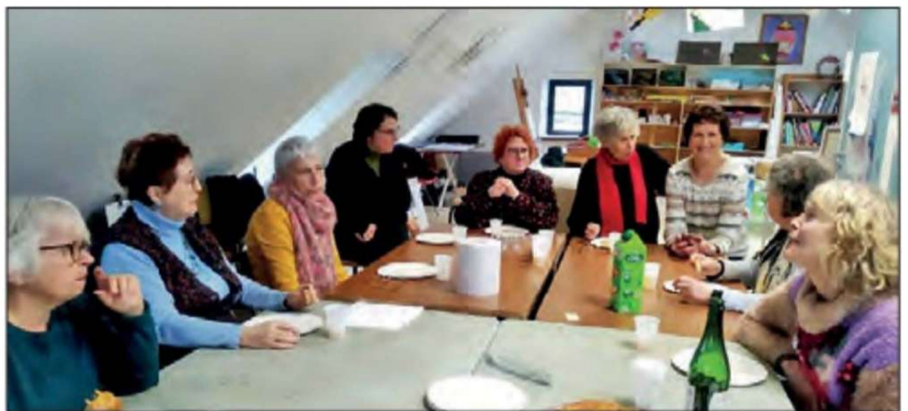
A l'atelier Boz'arts...