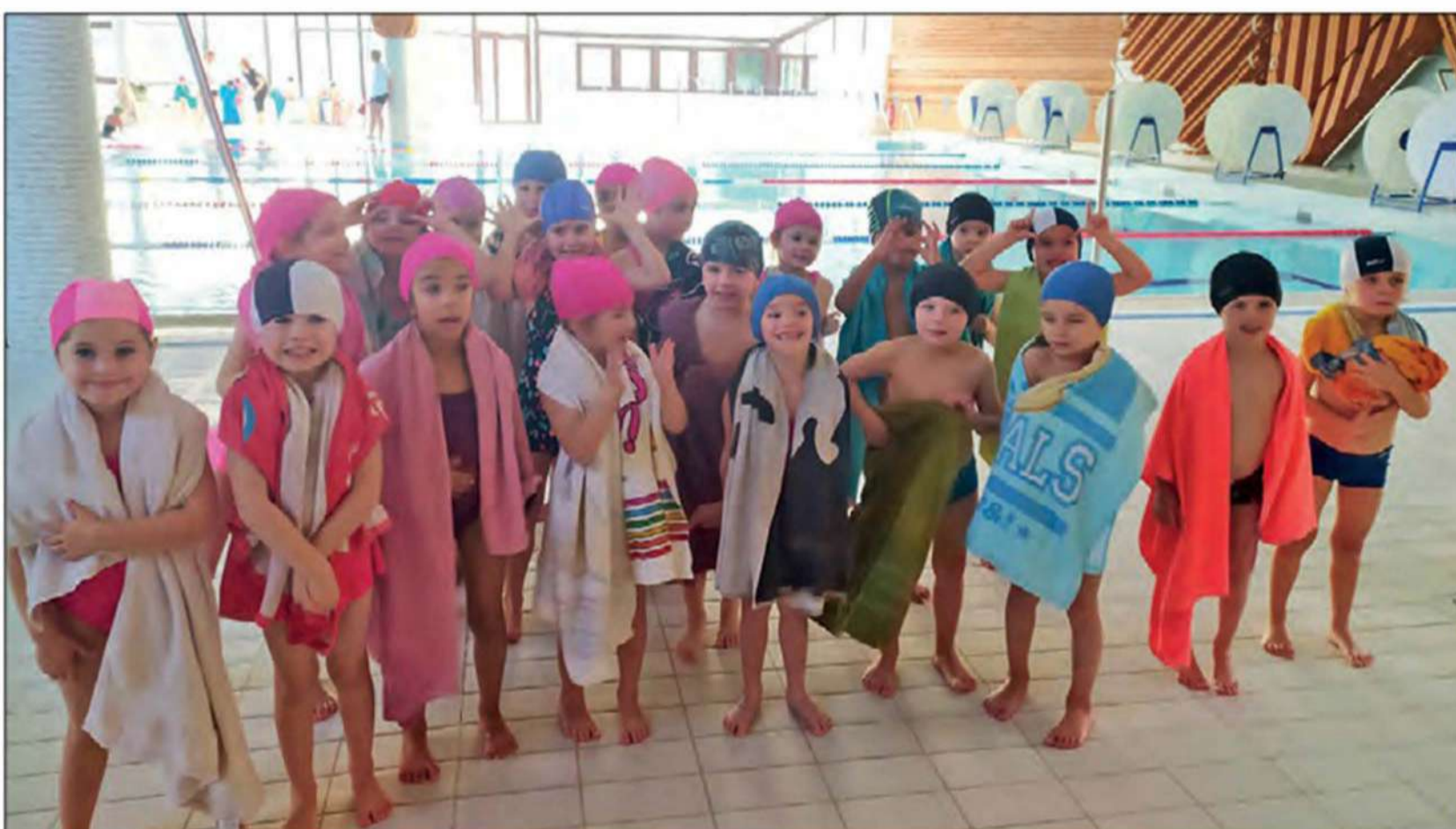
Les enfants ont apprécié l'activité.

En décembre, peu avant de partir pour les vacances de Noël, les élèves de Grande Section de l'école Arsène Ratier, accompagnés de leur maîtresse Isabelle Cuvillers, ont eu le plaisir de se rendre à la piscine Paul-Géraldini, d'Onet-Le-Château, pour participer à une «classe bleue» organisée par la Fédération Nationale de Triathlon.