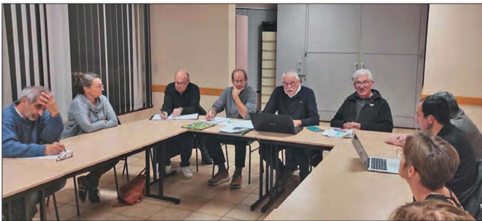
L'AOBO a tenu son assemblée générale.